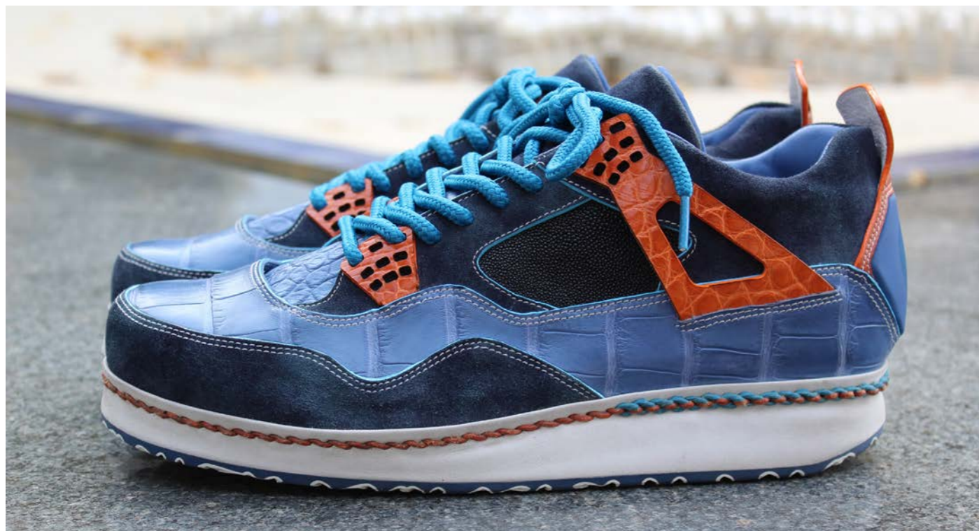
Sneakers Lux