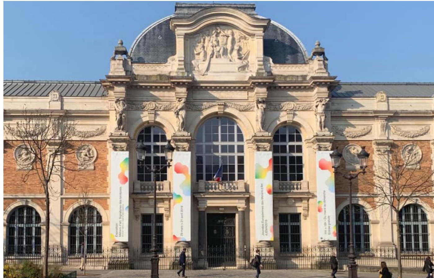
Le Mobilier national, Galerie des Gobelins à l'occasion des JEMA 2019