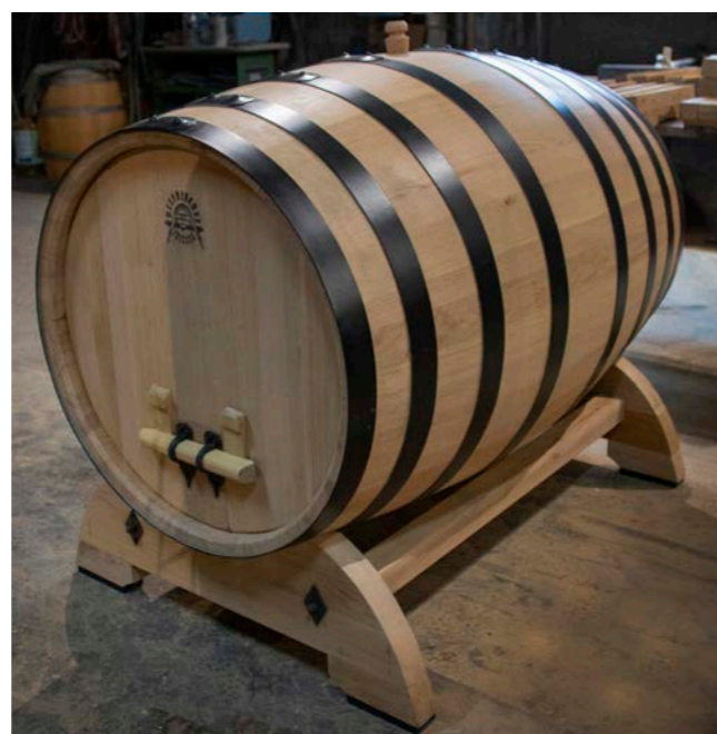
Fût normand de 987 L © Tonnellerie Desfrieches