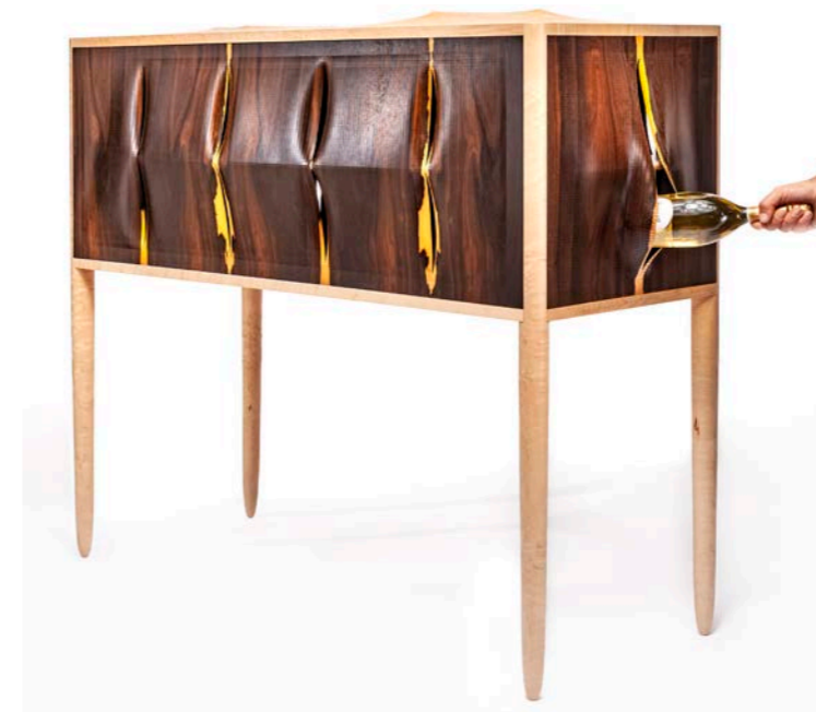
Squama , bahut sans porte ni tiroirs en WooWood © ARCA, Antoine Duhamel