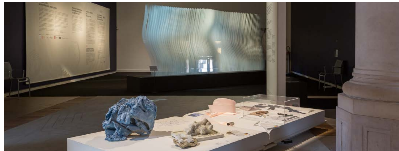
Exposition nationale des JEMA 2019, « Métiers d'art, Signatures des territoires » au Mobilier national, Galerie des Gobelins

Au carrefour du monde de l'art contemporain et de l'innovation dans les domaines des métiers d'art, et après avoir été en 1974 associé à la création de la Fiac (Foire internationale d'art contemporain), du Salon du livre en 1981, du Saga (Salon des arts graphiques actuels dédié aux imprimeurs et éditeurs d'estampes contemporaines et d'œuvres à tirage limité), Henri Jobbé-Duval intervient durant de nombreuses années dans le développement de salons internationaux, en particulier le Salon nautique et Art Paris. Il assure régulièrement le commissariat d'expositions d'art contemporain. En 2012, il est chargé par Ateliers d'art de France de mener à bien la création au Grand Palais de la première biennale internationale des métiers d'art et création (Révélation) dont il assurera le commissariat général lors des trois premières éditions. En 2019, l'INMA lui confie le commissariat de l'exposition « Métiers d'art, Signatures des territoires » qui a été présentée au Mobilier national, Galerie des Gobelins dans le cadre des JEMA.