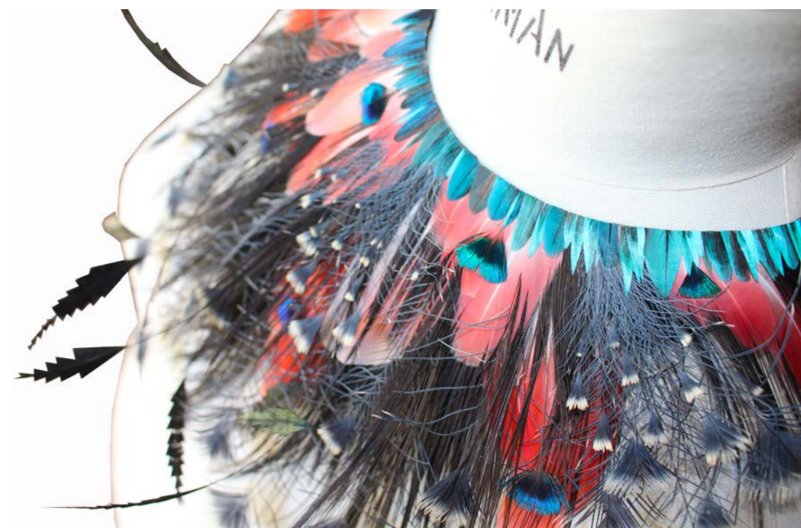
Plastron Crépuscule de Camargue © Prune Faux