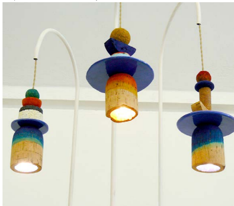
Suspension Pinto © Jeanne Guyon