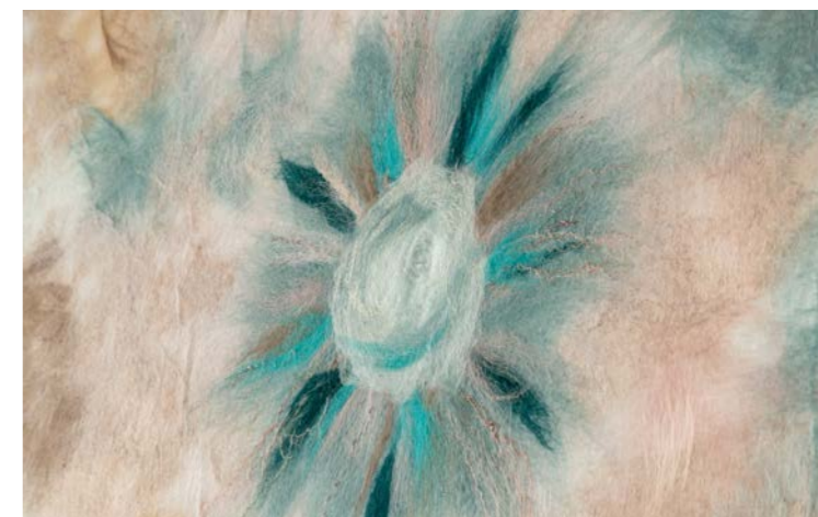
Point du jour, détail

Ce sont certaines de ces matières sources et ressources que le public sera invité à découvrir dans cette partie de l'exposition.