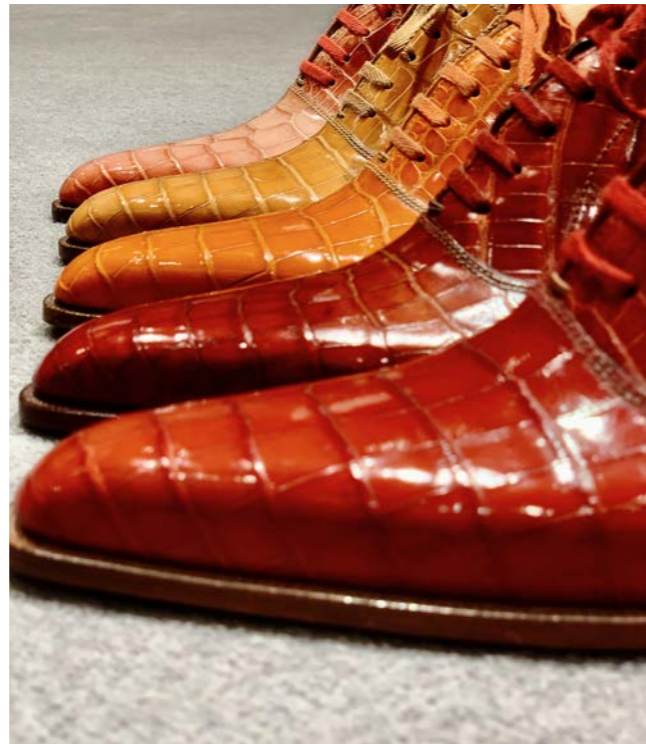
Le Cauchemar du Dandy © Maison Corthay