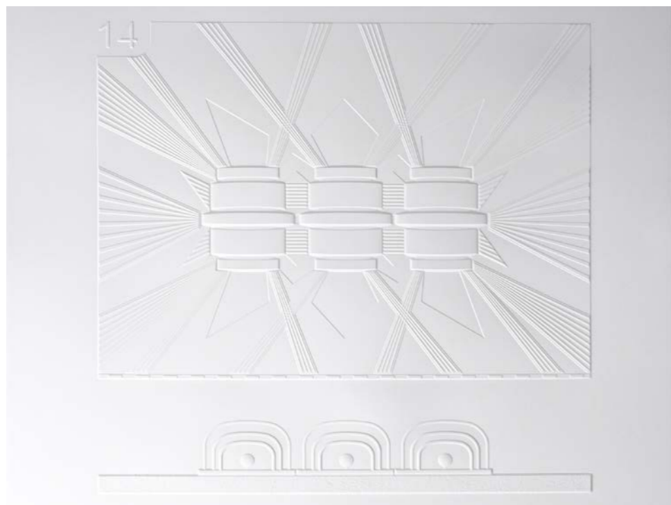
Planche n°14, Coffret de 29 planches tactiles Villa Cavrois, Robert Mallet Stevens © Créanog

C'est un monde nouveau et passionnant qui s'ouvre devant nos yeux.