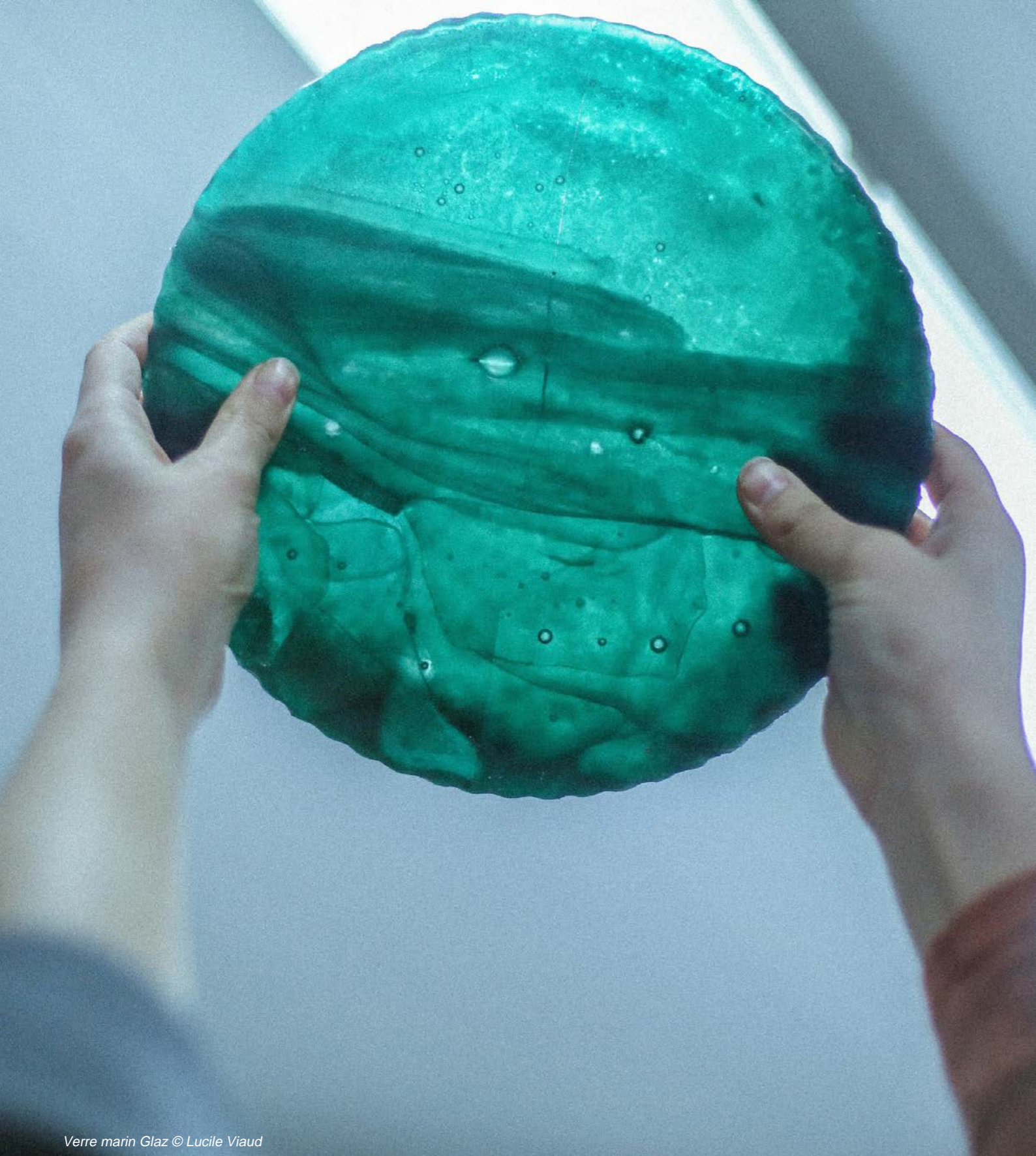
Verre marin Glaz © Lucile Viaud