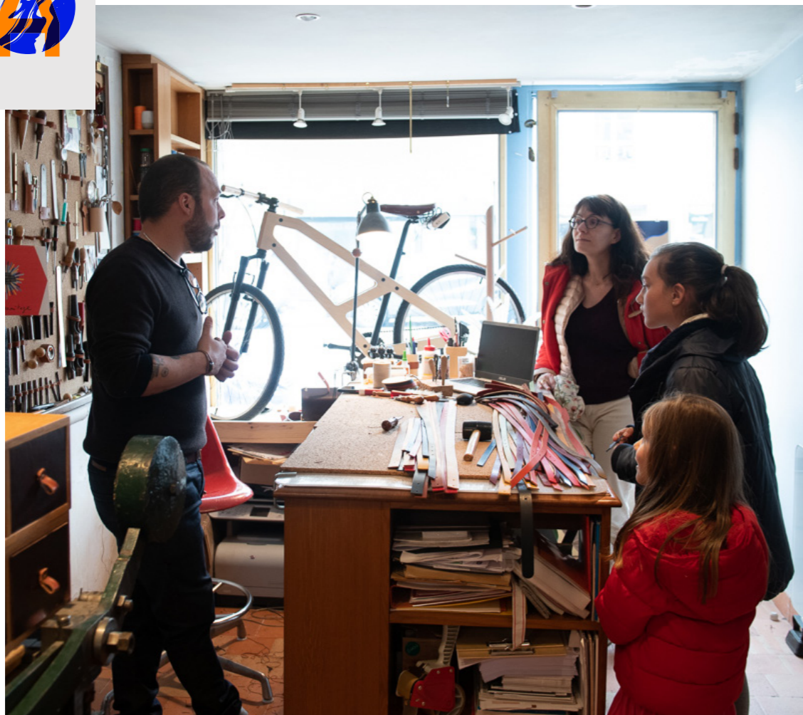
Versailles, Atelier Damien Beal