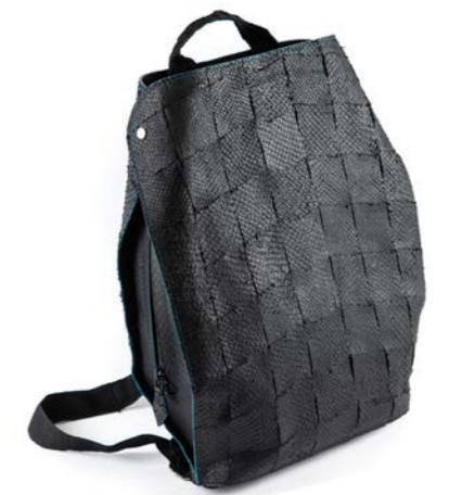
Sac Scalia