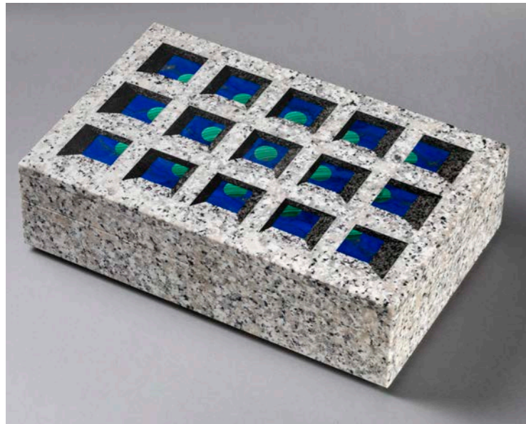
Atelier Élise et Berthaux, coffret Planètes