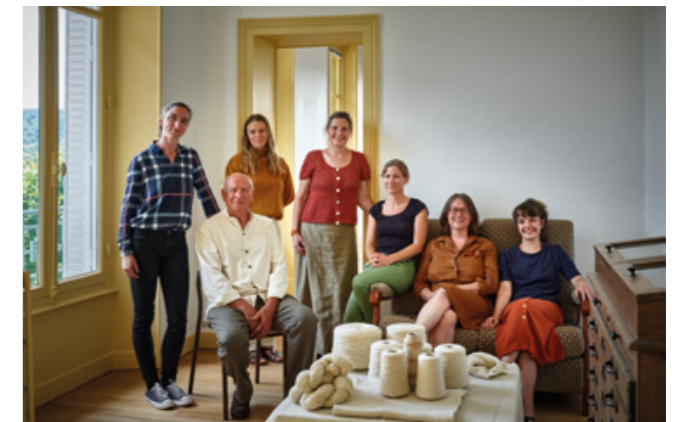
Équipe de l'association Lainamac