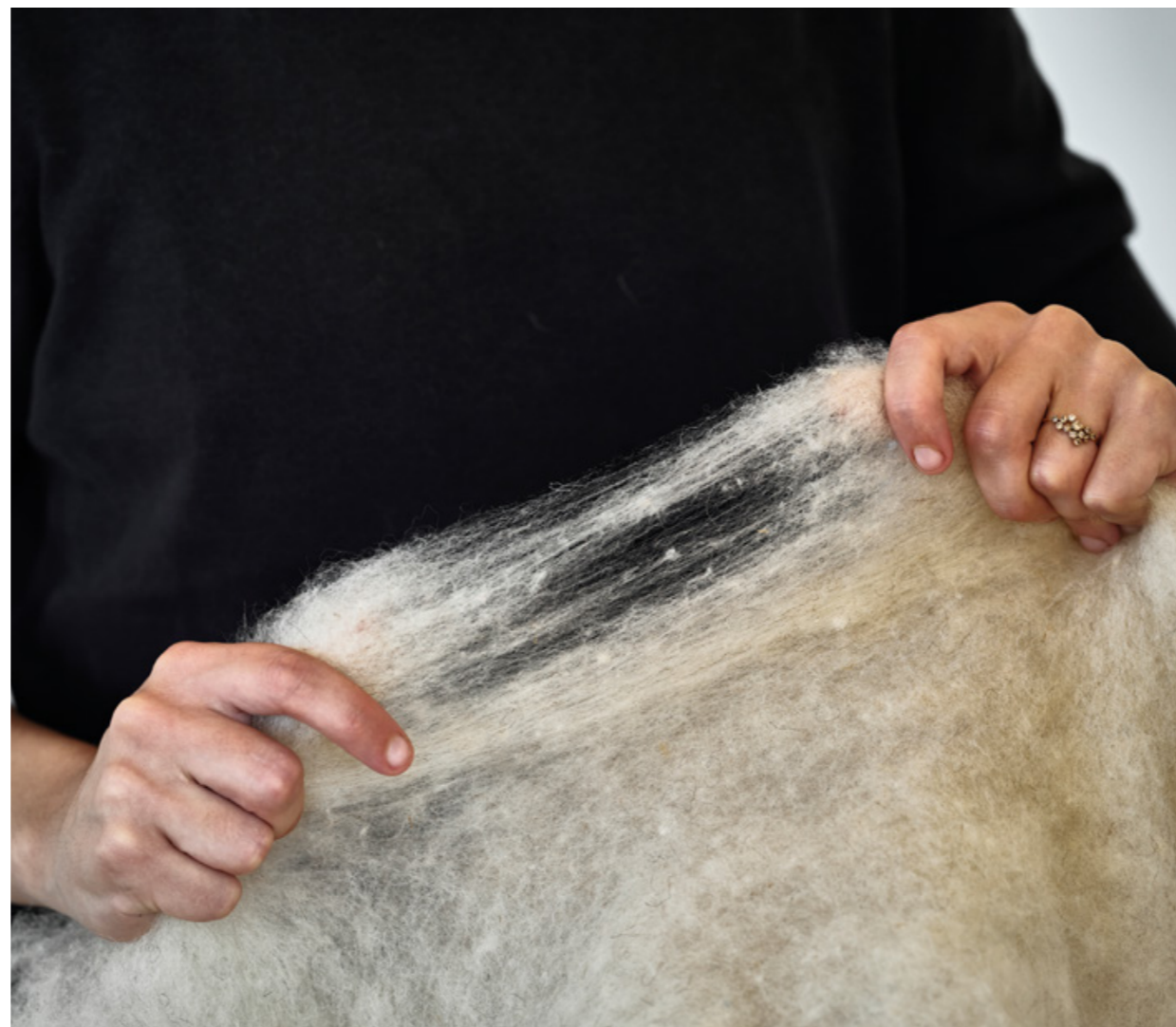
Pièce de laine brute dans l'atelier de Lainamac, lauréat Parcours Prix Liliane Bettencourt pour l'Intelligence de la Main®