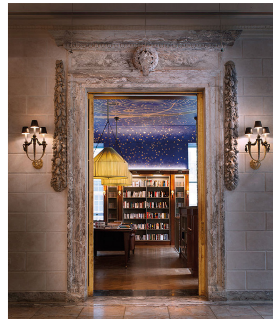
Vue intérieure du siège de la Villa Albertine à New York

Après la Villa Médicis, la Casa Velasquez et la Villa Kujoyama, la France s'est enrichie d'un nouvel institut culturel aux États-Unis. Baptisée Albertine, cette villa du XXI e siècle renouvelle le concept de résidence avec une vision contemporaine, délaissant le modèle d'une seule villa dans une seule ville, et affichant sa volonté de nouer des liens artistiques, culturels mais aussi commerciaux. Cette dimension économique a participé à l'adhésion de la Fondation qui a choisi d'accompagner le projet jusqu'en 2025, l'ouvrant une fois encore aux métiers d'art. L'opportunité de renforcer la visibilité de la création française aux États-Unis, de tisser des liens avec les grandes écoles et institutions du pays et de permettre aux artisans d'art de rencontrer les grands acteurs du marché américain, l'un des plus influents au monde.