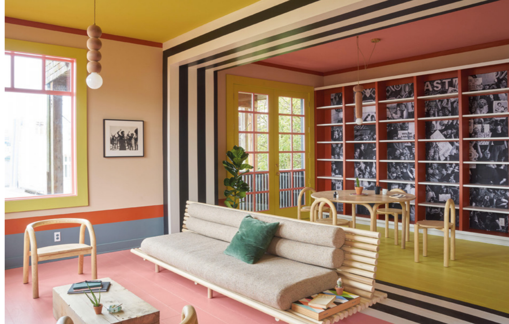
Vue intérieure de la Villa Albertine à San Francisco

26 résidences métiers d'art et design sur 5 ans