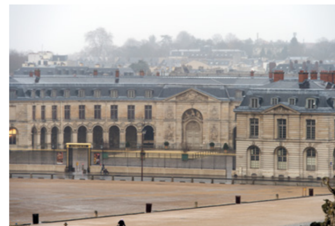
Vue extérieure de la Grande Écurie du château de Versailles

Plus de 2 000 jeunes et 60 établissements seront touchés directement par les programmes