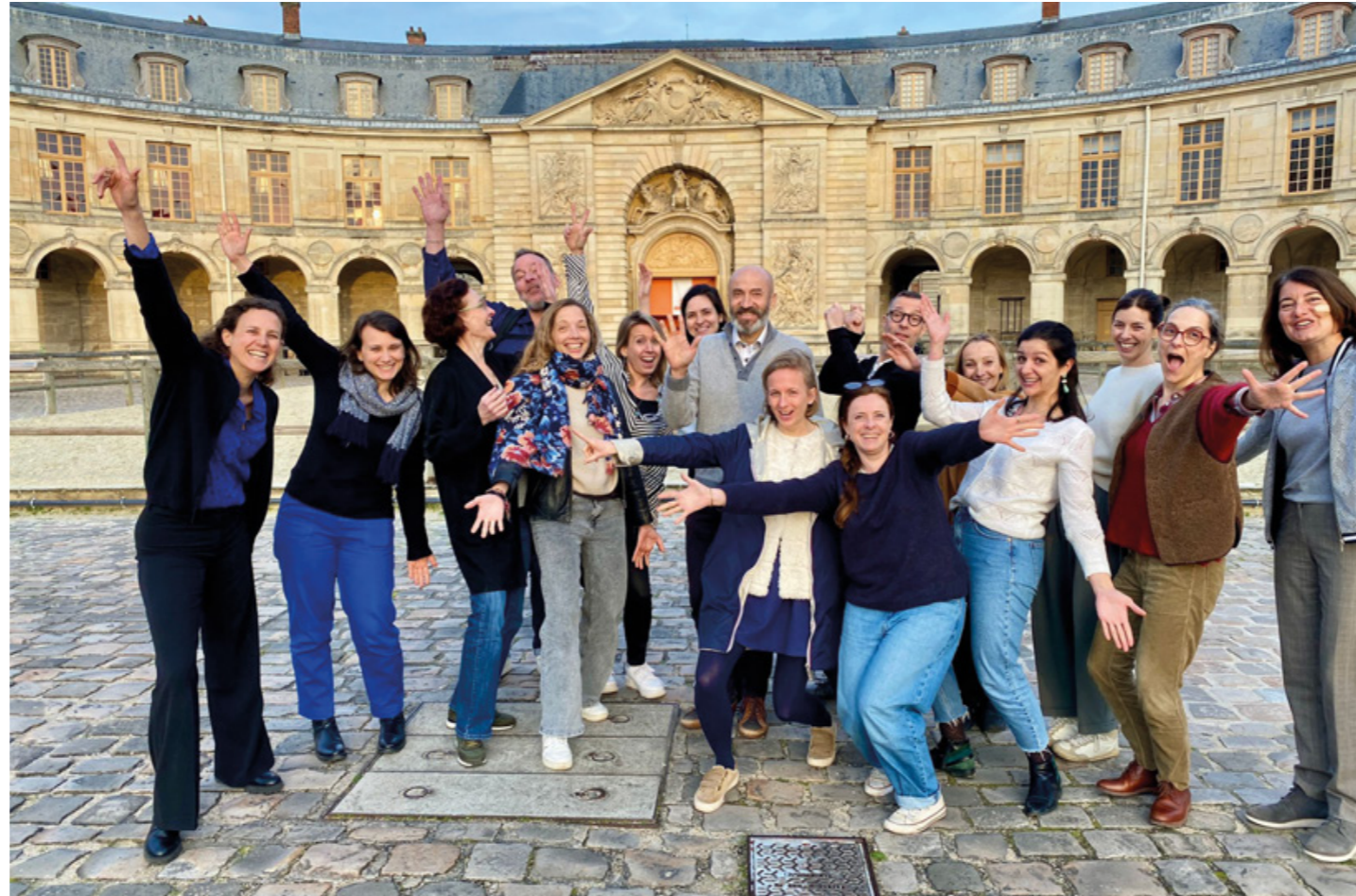
Membres du réseau Artisans d'Avenir devant le Campus Versailles