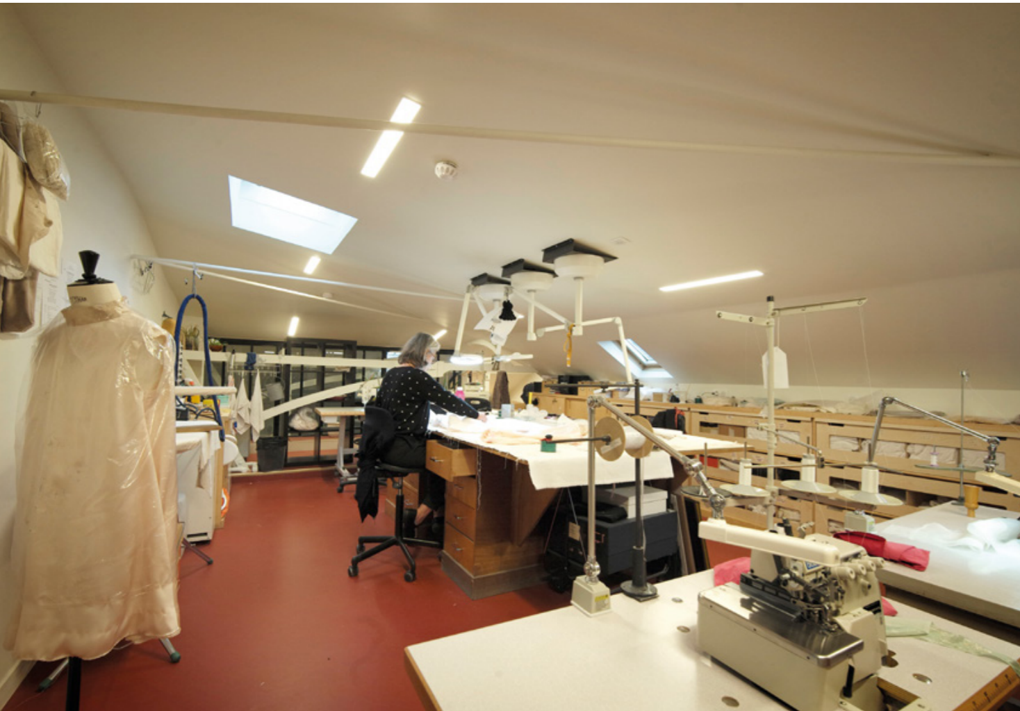
Atelier coiffure et lingères Comédie-Française