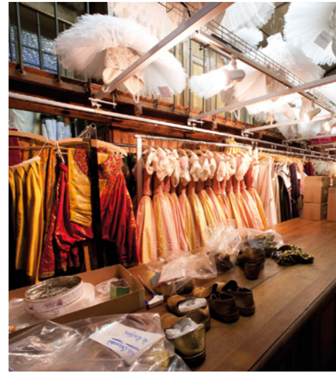
Atelier de couture

Longtemps restés en l'état, ces ateliers nécessitaient une importante modernisation afin de poursuivre leur mission et permettre aux artisans de travailler dans les meilleures conditions possibles, respectueuses notamment des normes en termes de sécurité et de respect de l'environnement. Face à ce constat, l'Opéra national de Paris a engagé le réaménagement des Ateliers Perruques du Palais Garnier. Accompagnée par la Fondation Bettencourt Schueller, cette démarche s'inscrit dans la politique globale de l'institution qui entend préserver et transmettre ces savoir-faire.