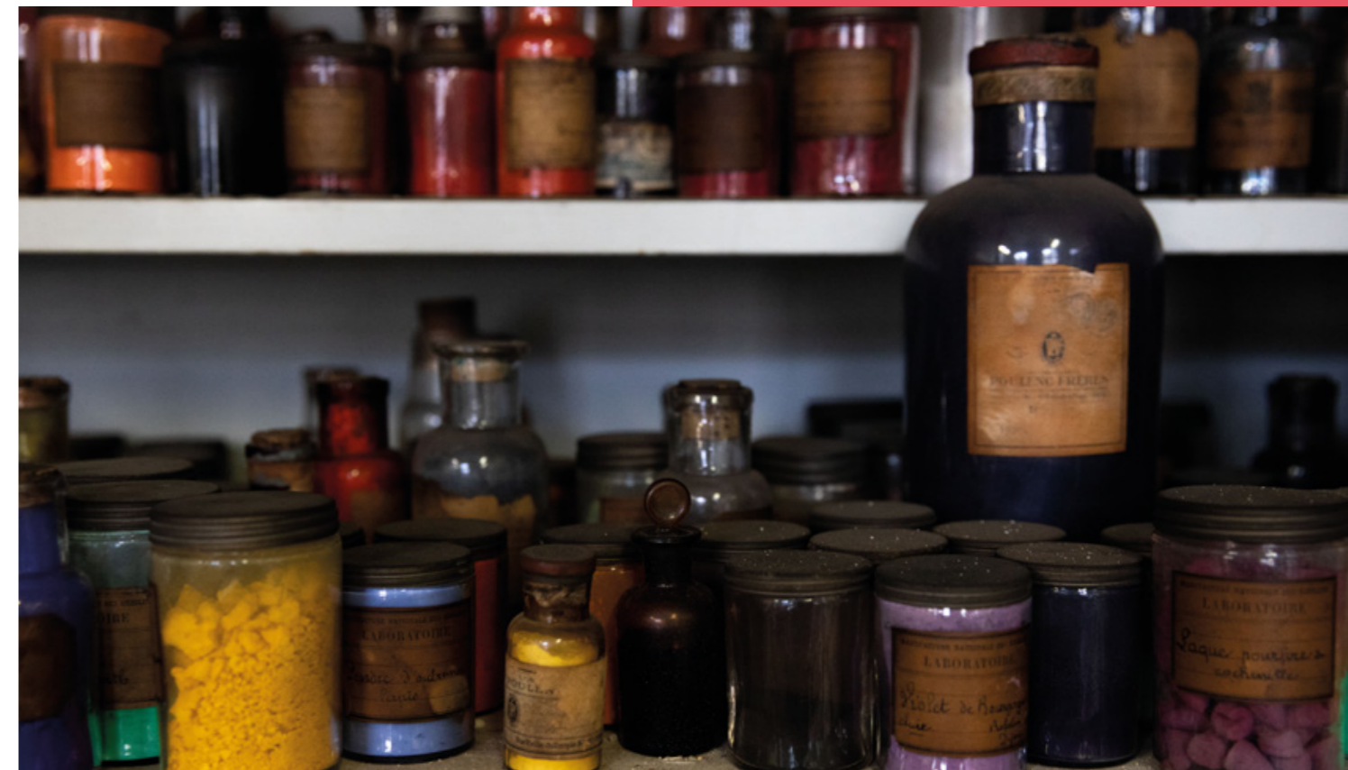
Atelier de teinture