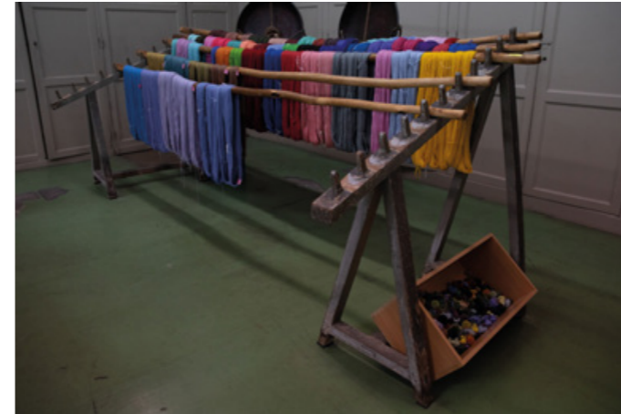
Atelier de teinture