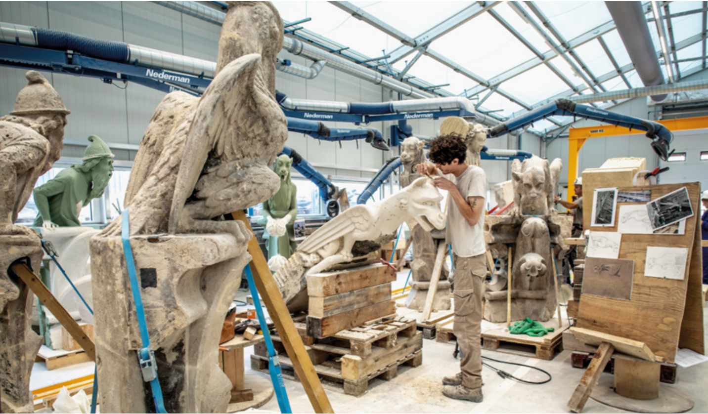
Reportage produit par GESTE/S magazine n°7 Automne 2023 avec le soutien de la Fondation Bettencourt Schueller et le concours de l'Établissement public chargé de la conservation et de la restauration de la cathédrale Notre-Dame de Paris