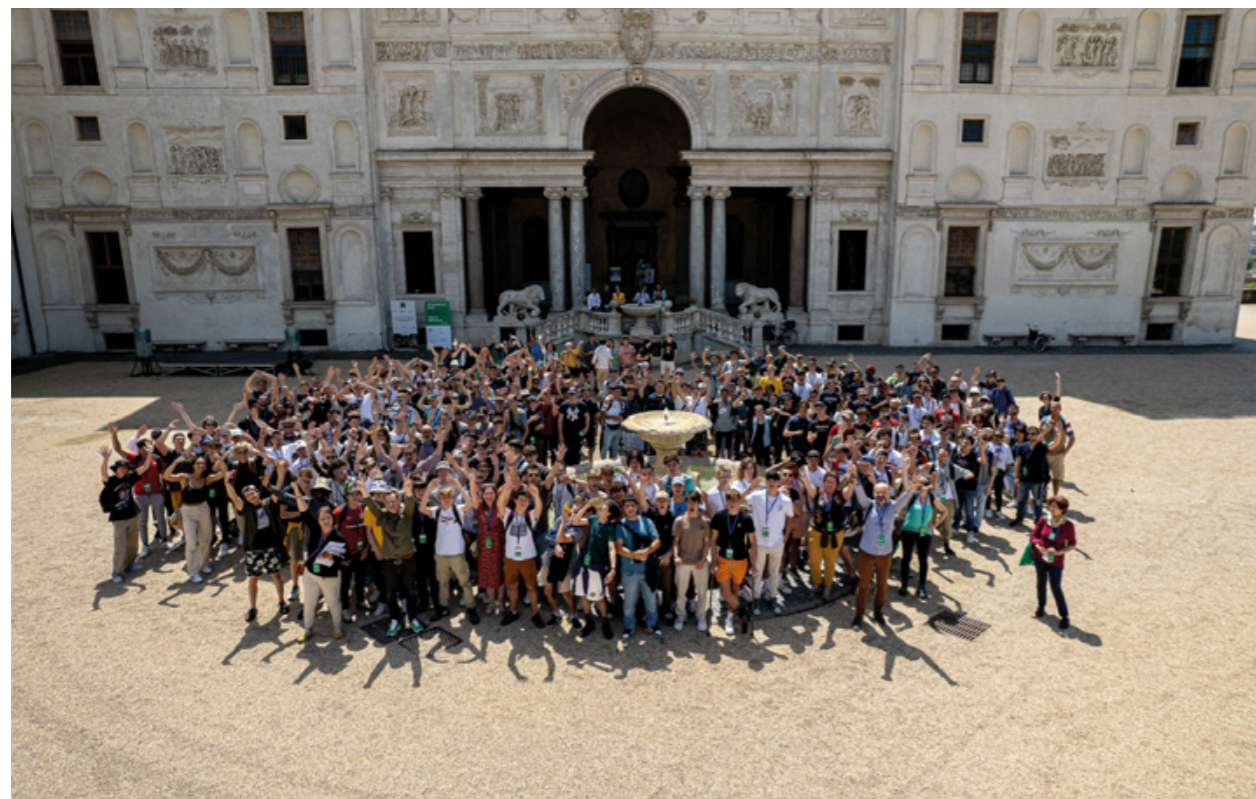
Élèves participant à la première édition de la Résidence Pro devant la Villa Médicis, à Rome, en mai 2022