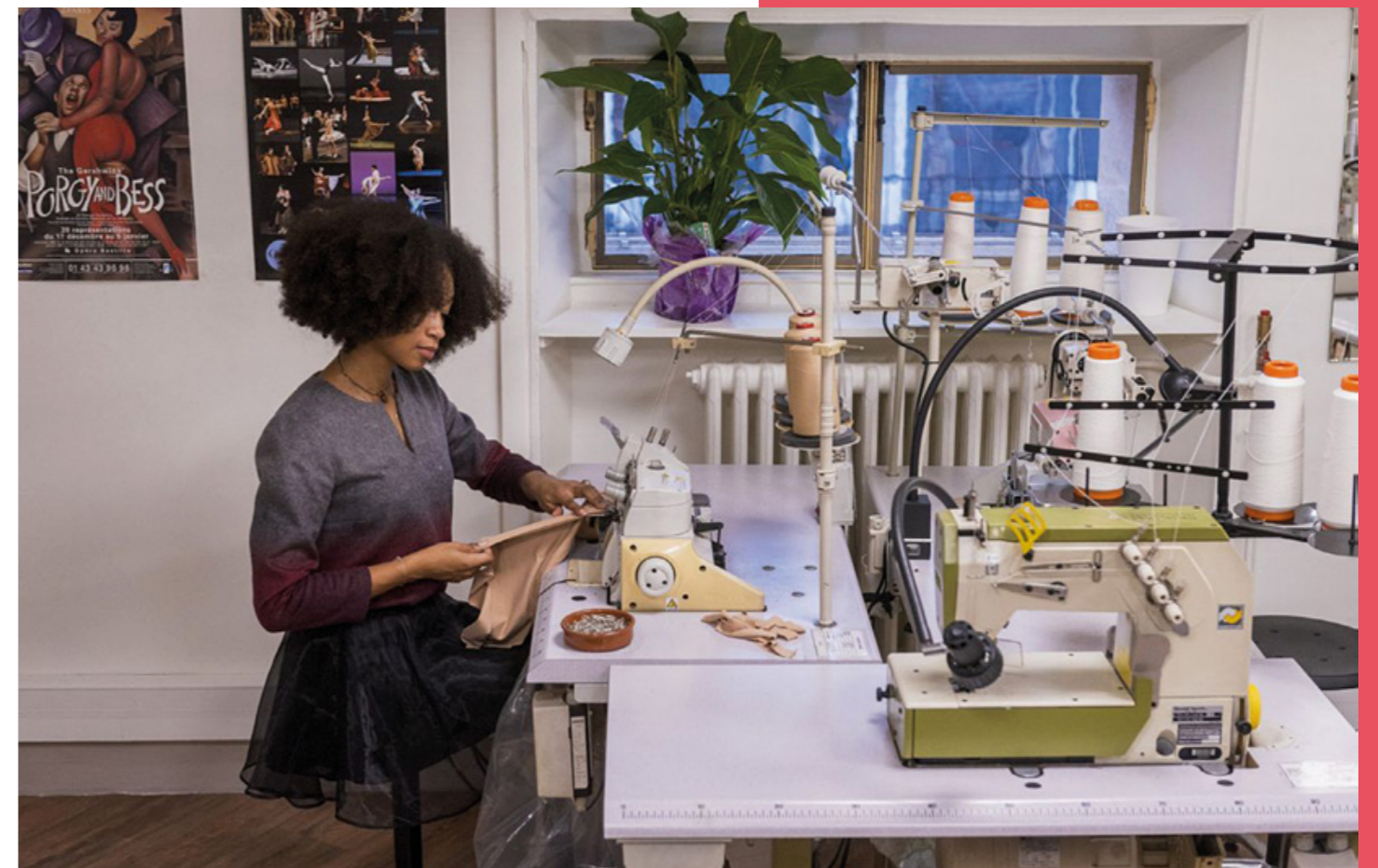
Atelier Tailleur Costume, Académie de l'Opéra de Paris

Y sont réunis des savoir-faire aussi diversifiés qu'exceptionnels, autour des costumes et des postiches