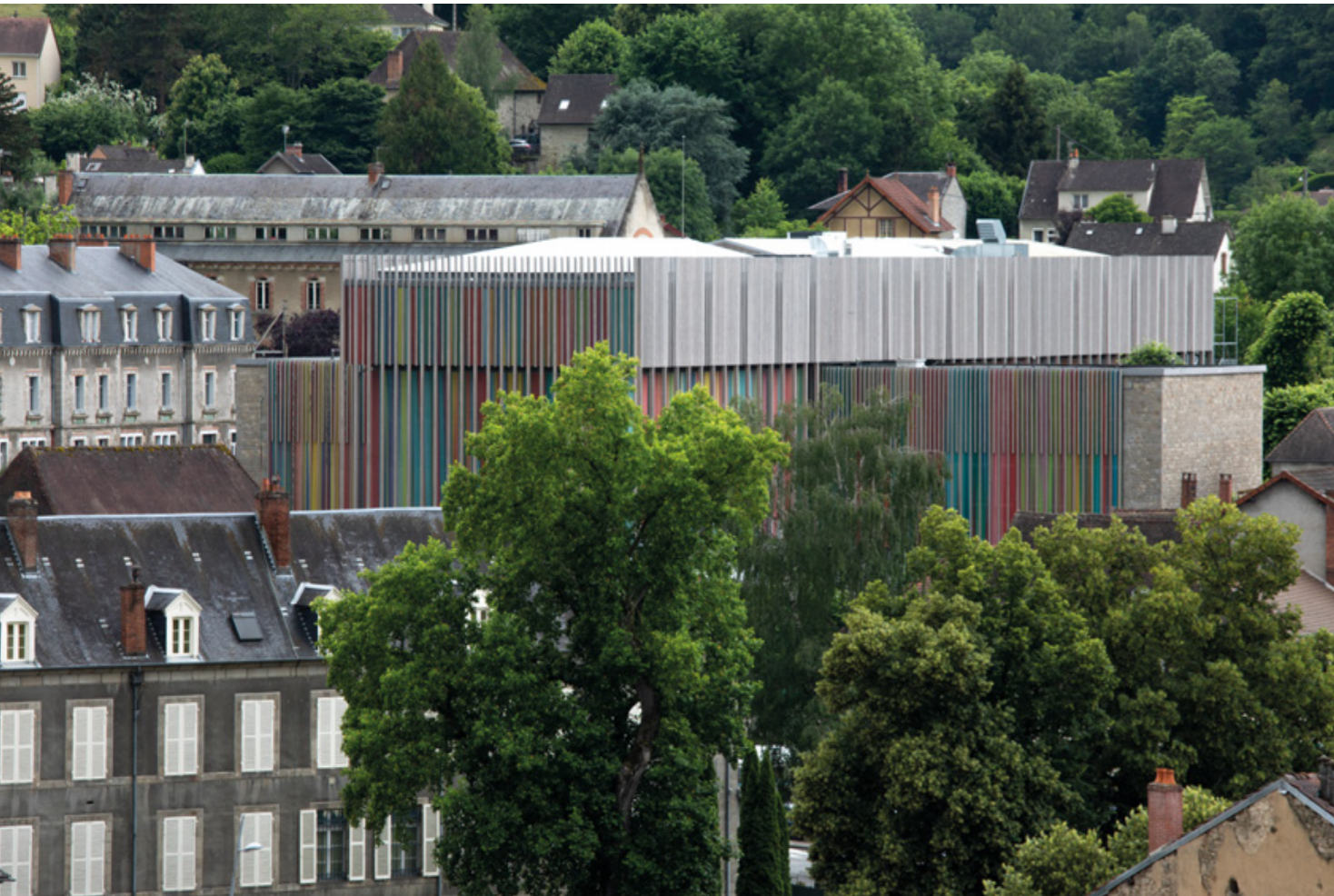
Vue extérieure de la Cité internationale de la tapisserie