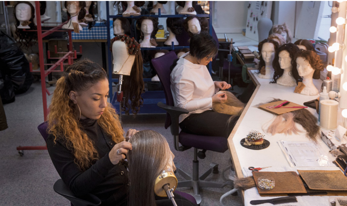
Atelier perruque maquillage, Académie de l'Opéra national de Paris