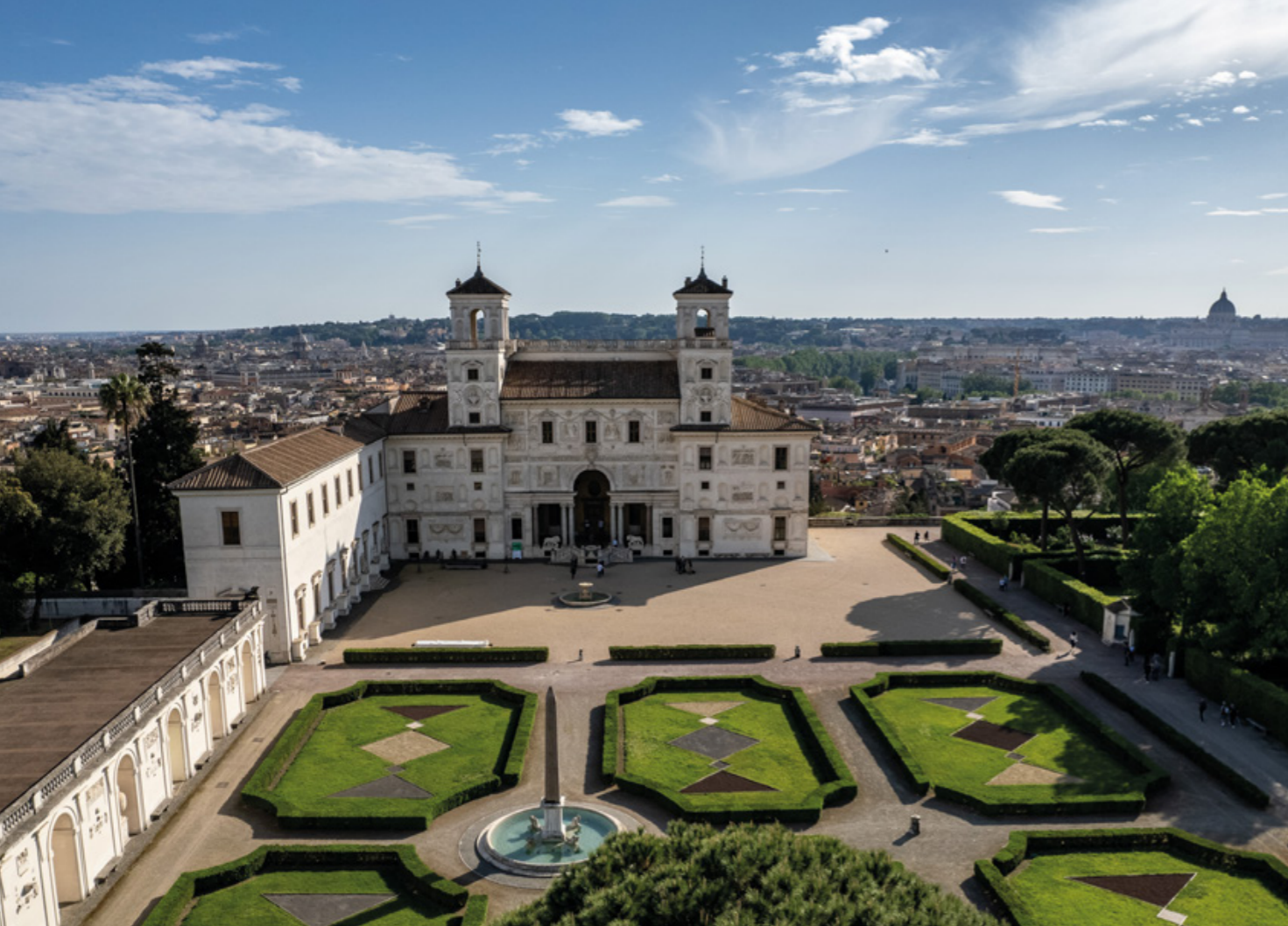
Vue générale de la Villa Médicis