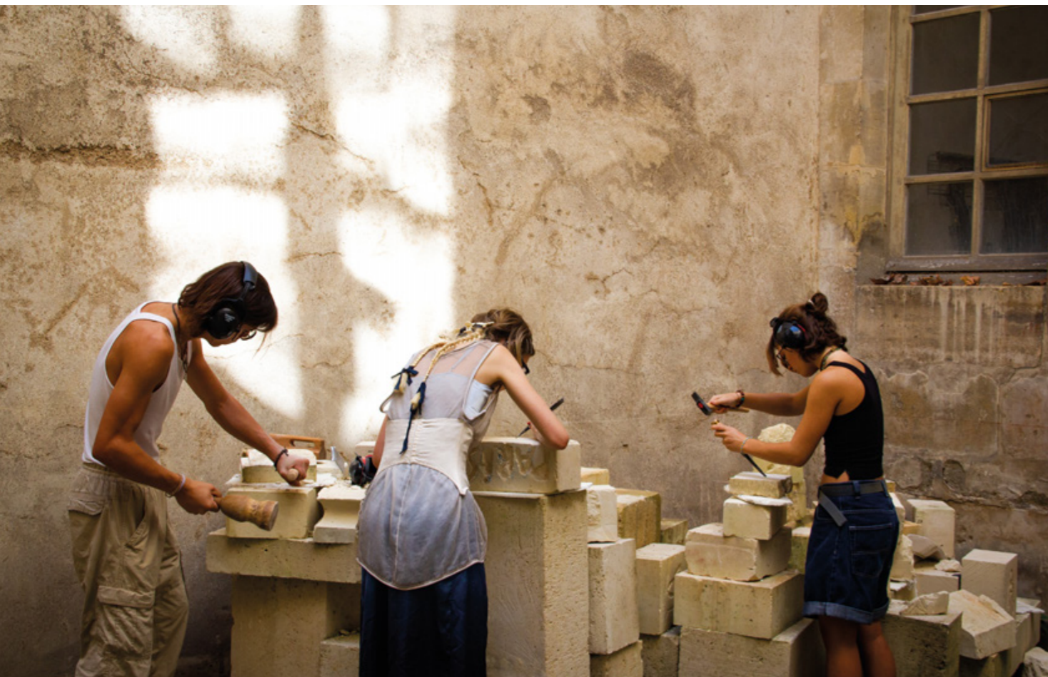
Campus Versailles