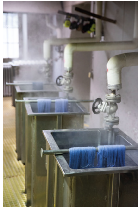
Atelier de teinture

Ces institutions remplissent ainsi un rôle de recherche et d'innovation essentiel pour permettre aux métiers d'art de conserver leur positionnement avant-gardiste et continuer à répondre à la demande de différents secteurs : industrie, art, architecture... Un objectif soutenu par la Fondation, qui initie là son premier accompagnement d'envergure en faveur de la recherche dans le domaine des métiers d'art. Une recherche dédiée aux questions d'écologie et de durabilité, également au cœur de la récompense Dialogues du prix Liliane Bettencourt pour l'Intelligence de la Main®.